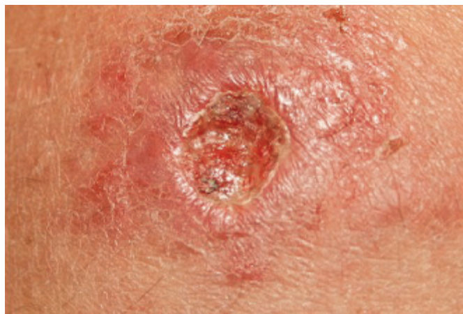
Figur 2. Fall 1: Infekterat sår med Leishmaniasis före första injektionen natriumstiboglukonat.

Leishmania spp överförs med sandmyggor av släktet Phlebotomus i Asien, Afrika och södra Europa och Lutzomyia i Syd- och Mellanamerika. I Afghanistan orsakas kutan leishmaniasis av framför allt L major och L tropica. I Östafrika kan infektionen även orsakas av den mer ovanliga subtypen L aethiopica och ge upphov till en mer diffus och utbredd hudinfektion. Till skillnad från de varianter av kutan leishmaniasis som