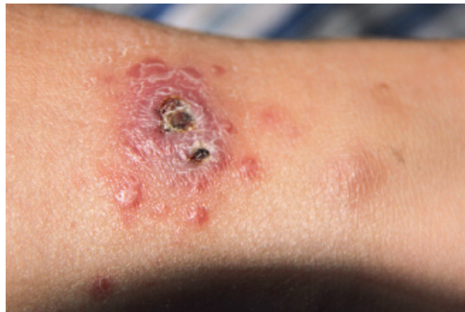
Figur 3. Fall 2: Sår med satellitlesioner, begynnande läkning efter två injektioner natriumstiboglukonat i Afghanistan.

finns i Syd- och Mellanamerika finns ingen risk för spridning av Leishmania-parasiter till slemhinnor hos de former av hudinfektionen som inträffar i Mellanöstern.